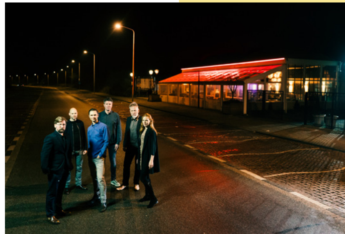
Ensemble Klang