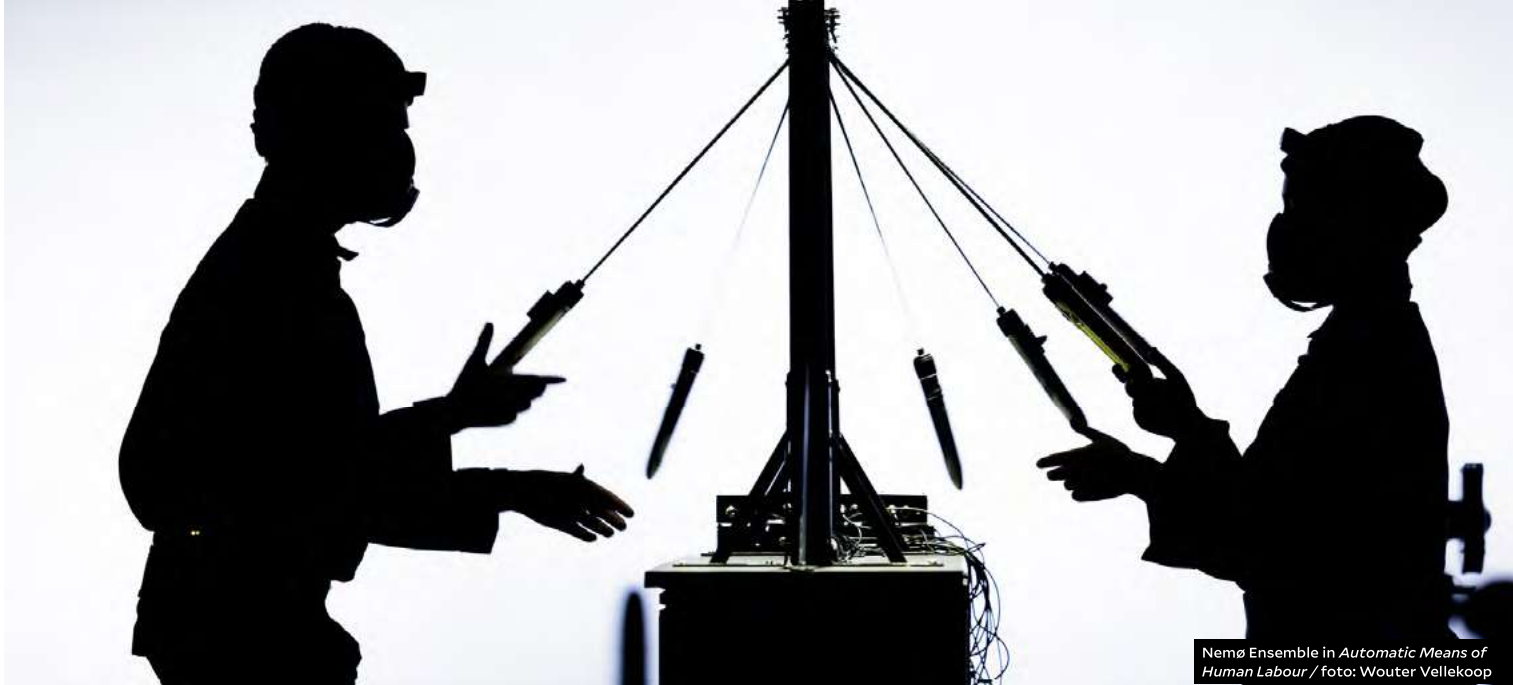
Nemø Ensemble in Automatic Means of Human Labour