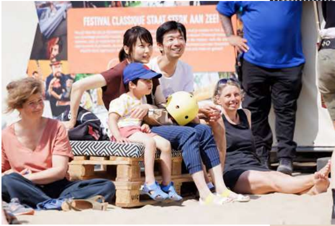
Ensemble 9x13 in Onder NAP