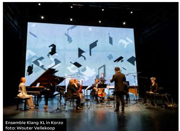
Ensemble Klang XL in Korzo

Over Arcanum (vertaling: 'mysterieuze kennis') zegt Lera Auerbach dat dit werk gaat over een soort diepere kennis die we bezitten maar niet kunnen verwoorden, die bestaat op een punt waar woorden tekortschieten.