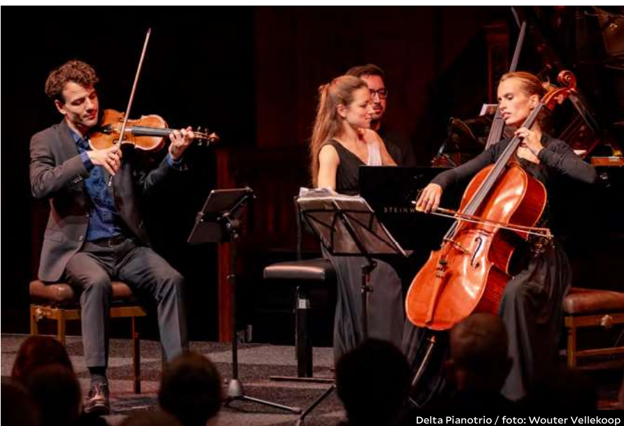
Delta Pianotrio