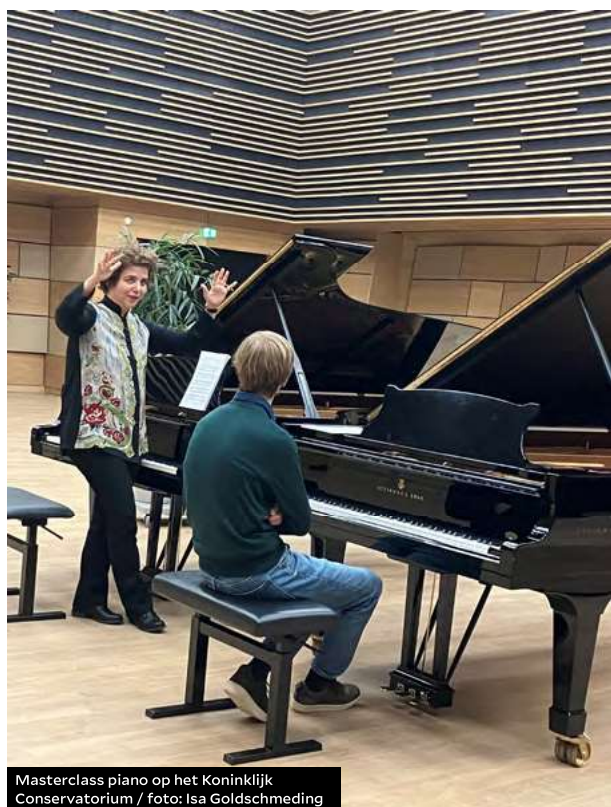
Masterclass piano op het Koninklijk Conservatorium