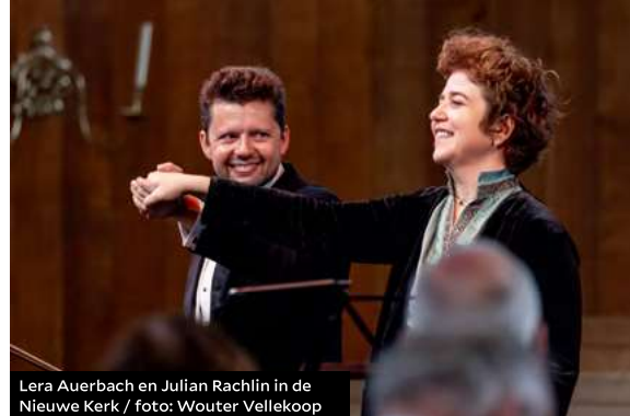
Lera Auerbach en Julian Rachlin in de Nieuwe Kerk