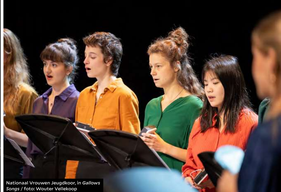
Nationaal Vrouwen Jeugdkoor, in Gallows Songs / foto: Wouter Vellekoop

erin om de achttiende en eenentwintigste eeuwse harmonieën samen te laten gaan tot een verzoenende eenheid. Het resultaat is een intens krachtig en expressief werk, dat subliem werd uitgevoerd door het New European Ensemble.