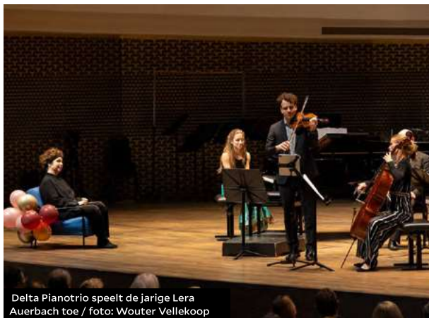
Delta Pianotrio speelt de jarige Lera Auerbach toe

Van de Nederlands-Australische componiste Kate Moore stond het werk Thorns op het programma. Dit werk is in opdracht van het Pianoduo Scholtes-Janssens geschreven en de première hiervan werd destijds ook gegeven met het New European Ensemble. Een bijzonder werk dat het verval van de schoonheid en van de natuur als thema heeft. Net als Auerbach voelt Moore zich sterk betrokken bij de klimaatcrisis en de gevolgen hiervan voor de mensheid.